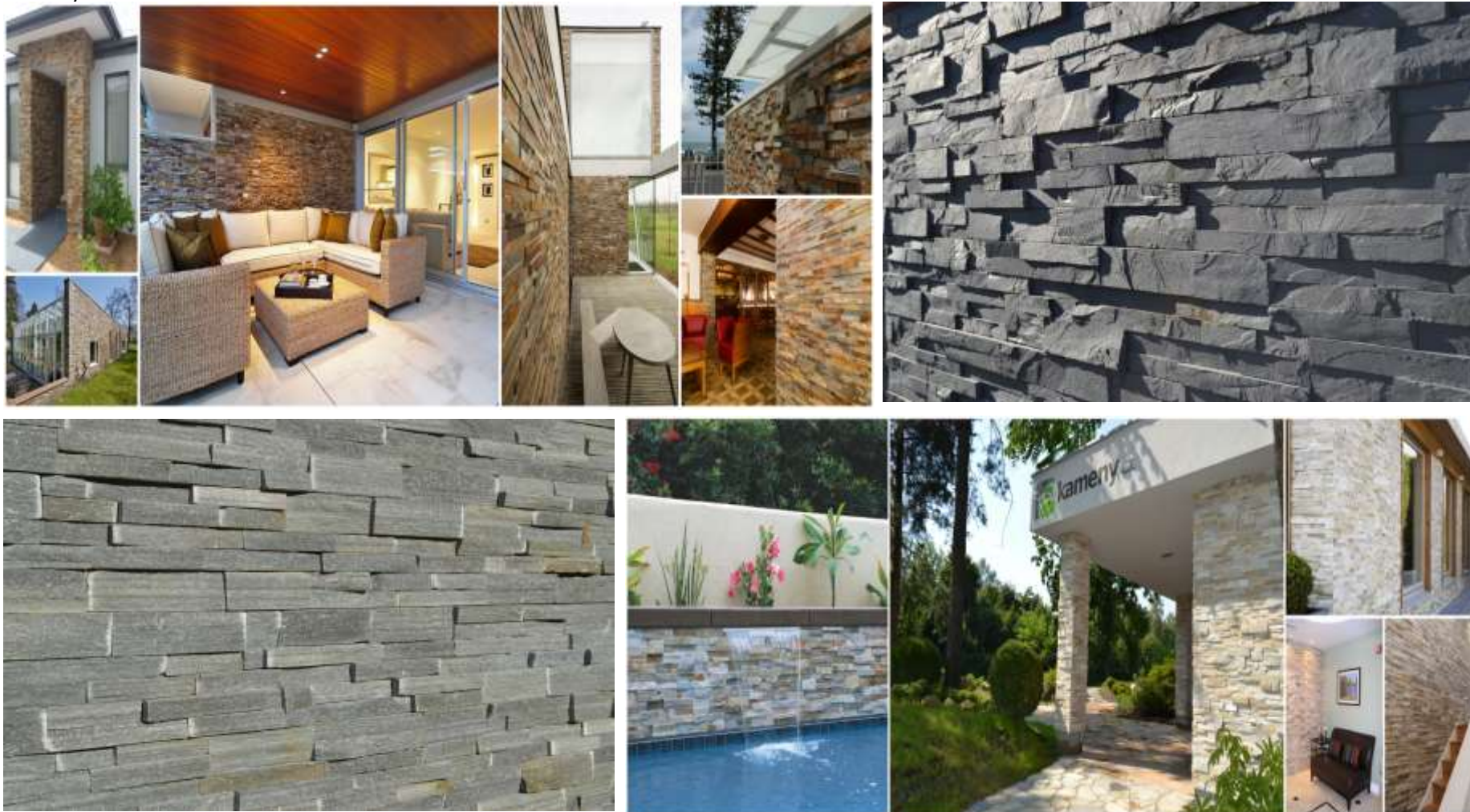
Obklady série Mureto: