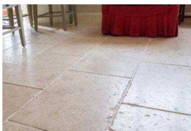
RIO, LIMA - CREM