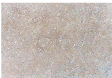
RIO, LIMA - MULTI