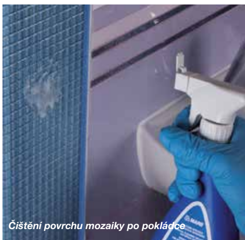
Čištění povrchu mozaiky po pokládce

Informace o tomto výrobku jsou k dispozici na požádání a na stránkách firmy MAPEI www.mapei.com a www.mapei.cz .