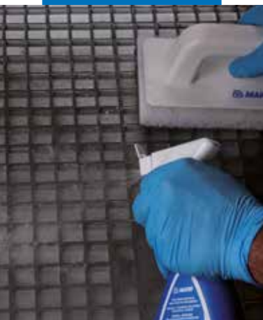
Nástřik výrobku Kerapoxy Cleaner na čišťený povrch