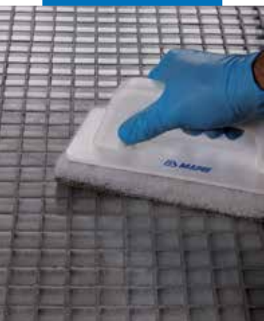
Čištění hrubou houbou Scotch-Brite®